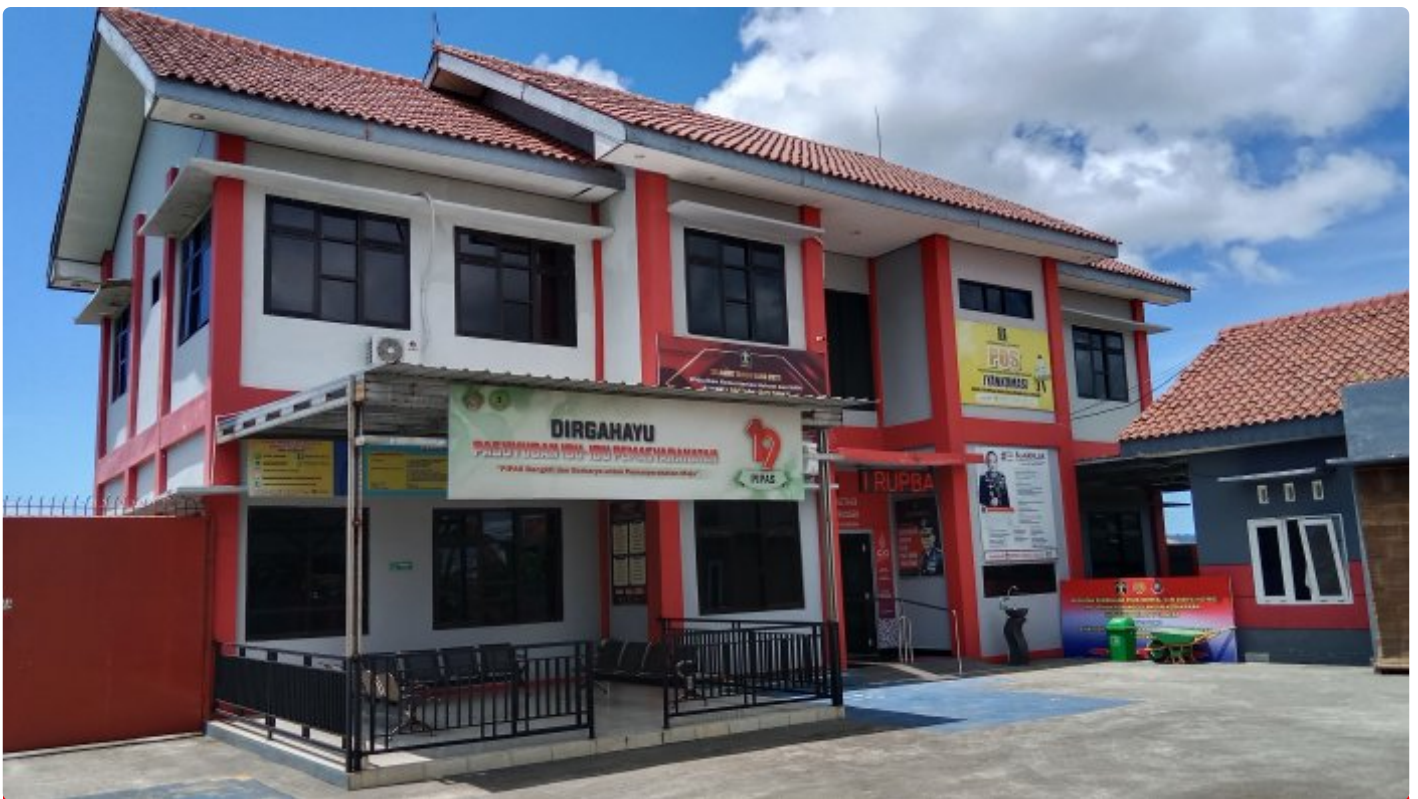
SOP Pengelolaan Basan Baran Rupbasan Kelas II Cilacap

Hai #SobatRupbasan yang budiman, berikut ini merupakan Standar Operasional Prosedur Pengelolaan Basan Baran di Rupbasan Cilacap.